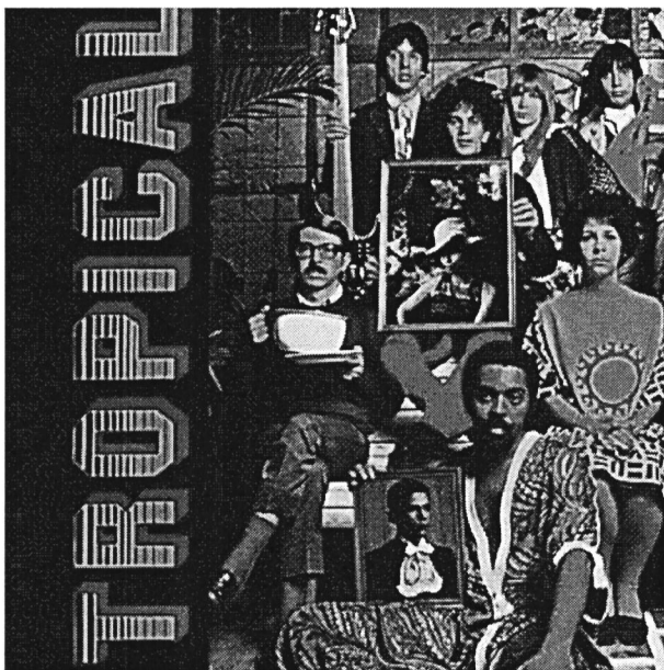
Capa do disco Tropicália ou Panis Et Circencis , 1968 (detalhe).

Questão 37. No contexto da arte brasileira, o movimento tropicalista se caracterizou por proposições marcadas pela experimentação estética. Em 1968, o disco Tropicália ou Panis Et Circencis se tornou símbolo do movimento.